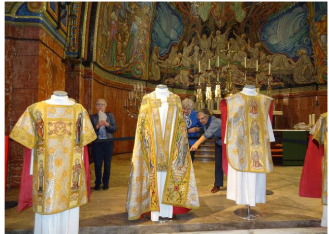
Bewondering voor het uitgestalde erfgoed.

In dit bestek is de rijkdom van de kerk niet benoembaar, maar een bezoek aan de kerk is mogelijk tijdens de kerkdiensten en op de eerste en derde zaterdagmiddag van de maand. Vrijwilligers zullen u graag het verhaal van de kerk vertellen.