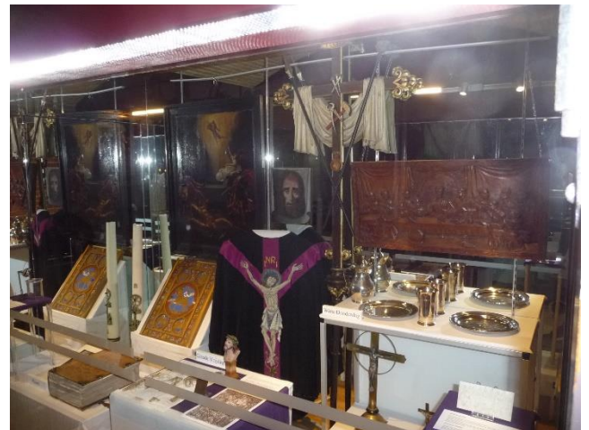
Tentoonstelling: Op weg naar Pasen

In het westen zijn wij gewend aan een blanke Jezus, andere culturen nemen uiteraard de vrijheid om Jezus uit te beelden naar hun beeld, in Afrika is Jezus een zwarte mens.