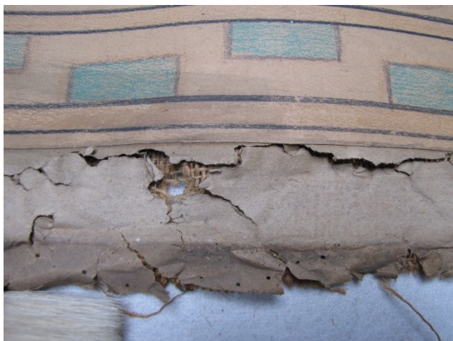
Detail van een kruiswegstatie voor de restauratie