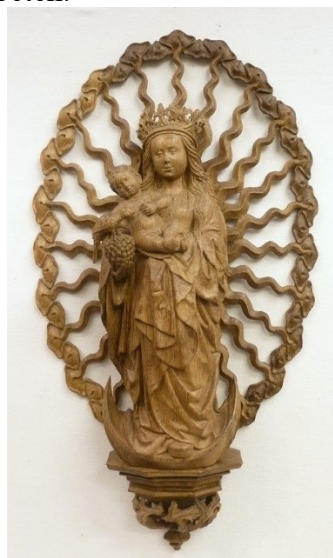
Onze Lieve Vrouwe van Wilsveen

09.30 uur inloop, koffie en thee 10.00 Opening door Wim van Leeuwen 10.05 Inleiding door Hester Schölvinc 10.50 Pauze 11.10 Presentatie van de voorwerpen uit de nieuwe tentoonstelling “Uit het zicht” 12.00 Afsluiting Wij hopen u, eventueel met een introducee, te ontmoeten.