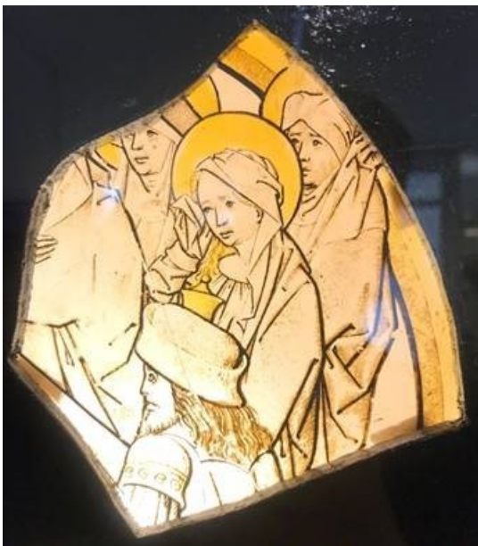
Fragment geschilderd glas Kartuizerklooster

In 1959 werd in Delft voor het eerst in Nederland een compleet klooster opgegraven: het Kartuizer klooster. Dit was in 1469 gesticht en ruim 100 jaar later, in de beginfase van de Opstand tegen Spanje, alweer gesloopt. Bijna 400 jaar bleef het terrein nagenoeg onaangeroerd onder de weilanden liggen. De vondsten en sporen vertellen het verhaal van het leven in het klooster van deze bijzonder strenge orde.