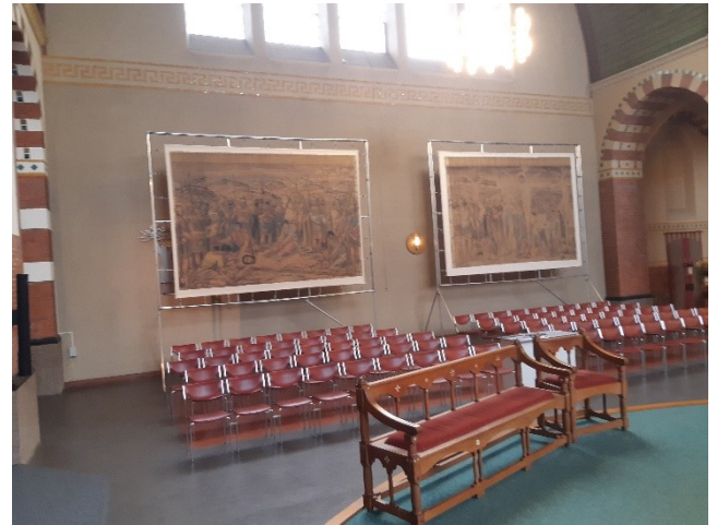
De twee staties in de Franciscus en Clarakerk in de Raamstraat.

naar kerken in het land waar alle acht de staties tentoongesteld kunnen worden.