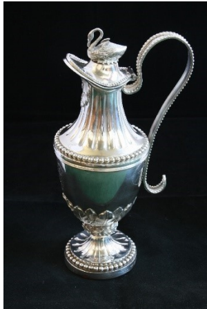
Doopkan van de Lutherse Kerk Delft

Het bestuur van de Lutherse Kerk gaf aan dat dit jaar de Lutherse Kerk wordt opgeheven en opgaat in de Protestantse Gemeente Delft. De historische kerk met bijgebouwen wordt in een aparte stichting ondergebracht, maar niet het roerend erfgoed. De belangrijkste stukken worden juridisch overgedragen aan het landelijk Luthermuseum in Amsterdam, met een terugleenovereenkomst zodat het in Delft blijft.